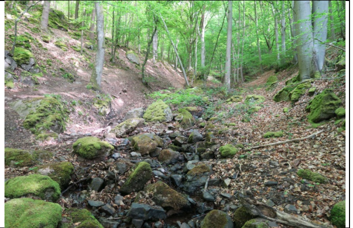
Petite cascade le long de ce sentier i2 qui constitue la limite entre les Communes de Profondeville (Lustin) et Namur (Dave)