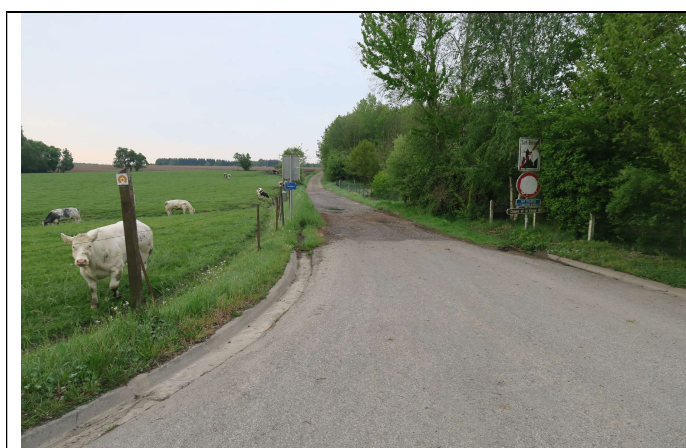
Début de la promenade, rue des Peupliers (SB 24)

Parcours (SB = Sart-Bernard, MA = Maillen) Les numéros font référence à la carte de Balnam.be. Les nombres précédés de « i » sont des voiries inconnues. Les autres nombres correspondent au numéro de la voirie vicinale.