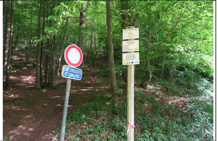
On arrive ainsi au début du sentier i2 (Lustin i2) qui monte très fort et situé derrière le panneau « Exc. Cyclistes et Cavaliers ». Ne pas prendre le chemin avec barrière.