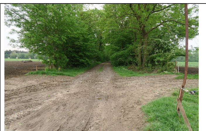
Rue des Peupliers, entrée dans le bois (SB 24)