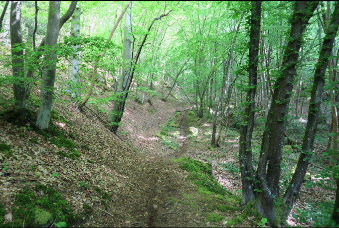
Le sentier grimpe assez fort