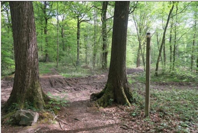
Le sentier i2 tourne à gauche mais vous continuez légèrement vers la droite par le sentier i24 (Dave i24)