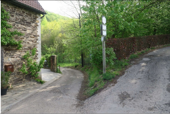
Ensuite on tourne à droite pour prendre le chemin 17bis (Lustin 17bis)