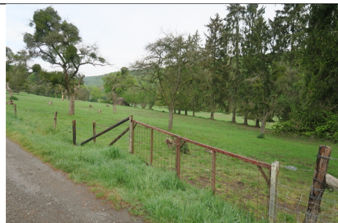
Superbe vallée du Tailfer vu de la rue du Bois d'Arche (Ma i8) et entièrement située en Natura 2000

C'est ici que devrait débuter le chemin i6 (Ma i6) qui conduit directement rue des Acremots à Lustin via le chemin 39 (Lustin 39) mais le passage à droite de la barrière a été fermé et un fil de fer barbelé empêche d'ouvrir la barrière. En attendant son ouverture, on continue sur la route.